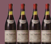
4 Bouteilles de la Tâche 1959 13.750 €