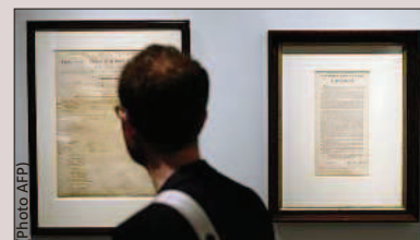
d'émancipation, qui ordonne la reconnaissance de liberté des personnes maintenues en état d'esclavage, s'est elle adjugée à 2,17 M$.

Mercredi dernier chez Sotheby's New York, l'Institut d'histoire américaine Gilder Lehrman a acquis pour 2,41 M$ le texte du XIII e amendement de la Constitution américaine signé de la main d'Abraham Lincoln. Approuvé le 1 er février 1865, ce texte fondateur avait aboli l'esclavage sur le territoire américain quelques semaines avant l'assassinat de Lincoln et la fin de la guerre de Sécession. Un des exemplaires de la proclamation