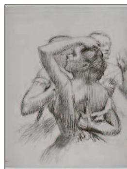
Trois danseuses en buste, Edgar Degas.

sins jusqu'en 2013, l'estampe avait depuis intégré une liste de 27 œuvres que l'Etat souhaitait restituer à ses ayants droits. Jusqu'à présent, la demande relevait des familles mais l'Etat s'est adjoint les services de l'organisation des Généalogistes de France pour mener à bien sa quête.