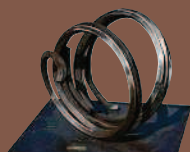
Bernar VENET, né en 1941 Deux lignes indéterminées Sculpture en acier 38 x 48 x 38 52.710 €