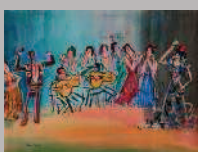
Jean DUFY 1888-1964 Flamenco, circa 1955 Aquarelle, gouache sur papier marouflée sur toile signée 48 x 64 18.825 €

SPECIALISTE DES VENTES DE PRESTIGE DEPUIS 1989 CLASSÉ AU 9 ÈME RANG MONDIAL DES VENTES DE VINS